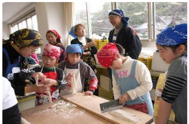
手作りうどん体験